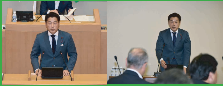
▶ 令和6年9月 決算議会代表質疑 ▶ 令和6年9月 決算特別委員会