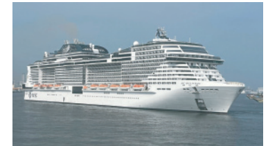
▶ MSC BELLISSIMA が入港

『クルーズ客船の受け入れ』：新型コロナウイルス感染症拡大の影響により、外国籍船の運航が休止されてきたが、今年3月、3年ぶりとなる国際クルーズの受け入れが再開しています。日本籍船・外国籍船の神戸への寄港はもとより、クルーズの発着港となれば地域経済への波及効果が大きいと考えています。発着港としての客船誘致に力を入れるべき、と質疑しました。