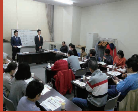
▶ JR摩耶駅での街頭活動 ▶ 衆議院議員・いさか信彦との地域まわり、国政・市政報告会