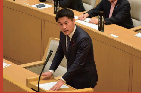
▶ 平成29年6月 一般質問②