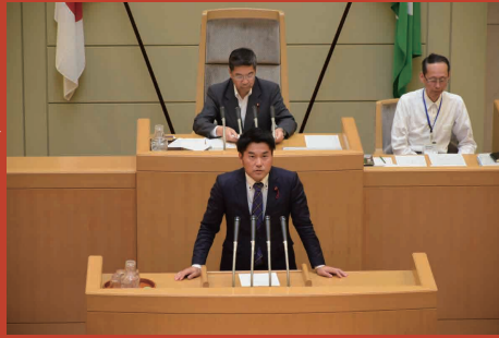
▶ 平成29年6月 一般質問①