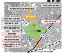
王子公園の主要施設