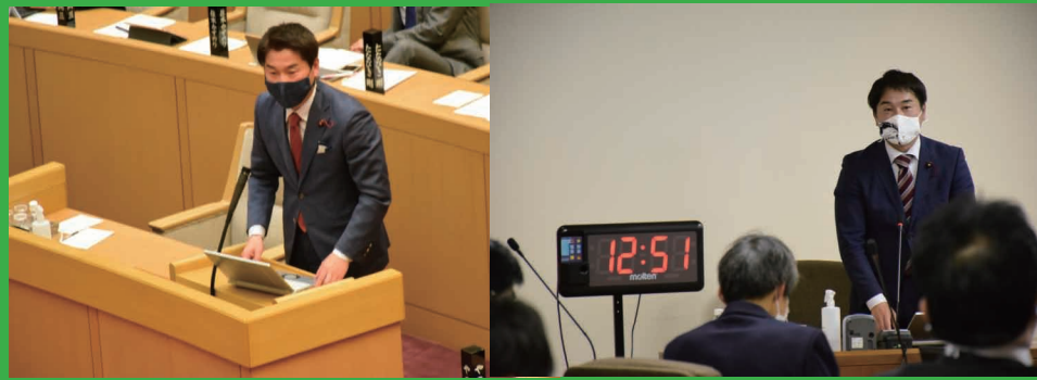
▶ 令和3年2月 予算議会代表質疑 ▶ 予算特別委員会