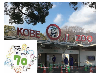
▶ 70周年を迎えた王子動物園

TEL: 070-1930-2368 FAX: 078-271-3707 mail: info@isayama-daisuke.jp