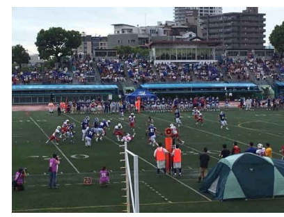
▶ 王子スタジアムで開催されるアメリカンフットボールの試合